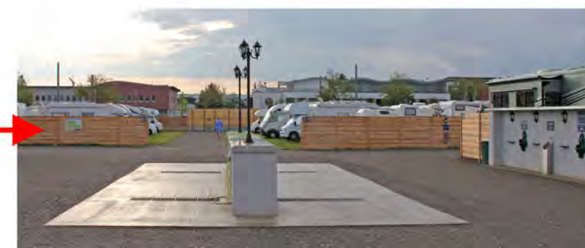
4 x Effluents de queue et d'alimentation