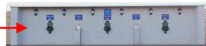
5 x centres de stockage de toilettes à cassette